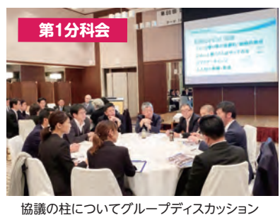
協議の柱についてグループディスカッション