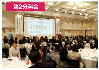
二人一組になりコーチングを活かして自己紹介