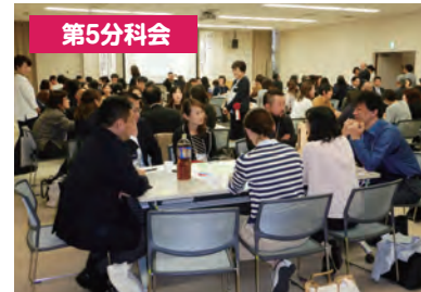
美味しそうな話題と笑顔が絶えないグループ協議