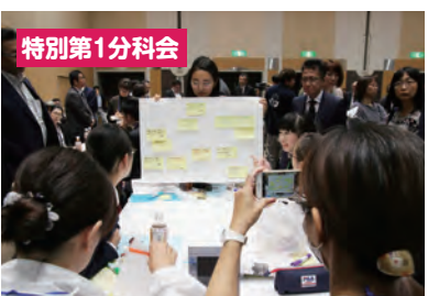
テーマ毎に席替えをしてワールドカフェ