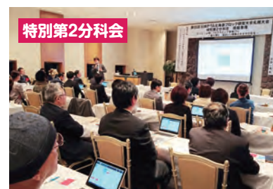
タブレットを使用して模擬授業