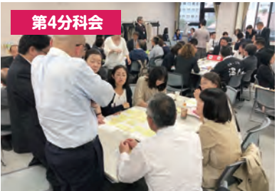
協議の柱について、付箋を用いて意見交換